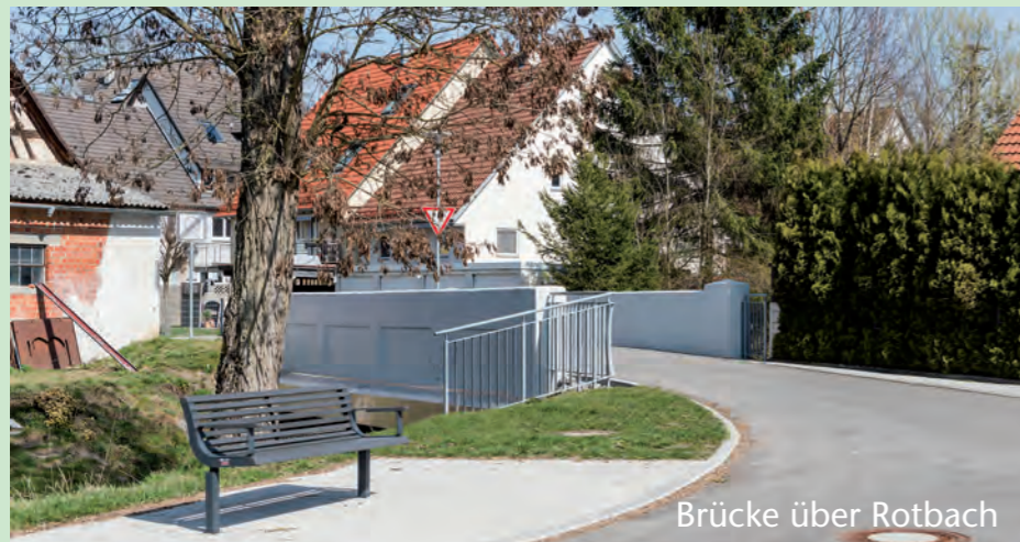
Brücke über Rotbach