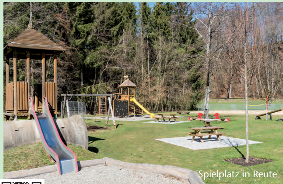
Spielplatz in Reute